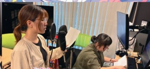
じつじょう 実況・MCコース