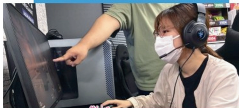
せんしゅ 選手コース