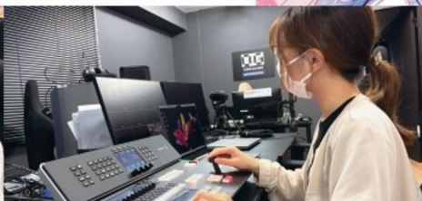
いべんと イベントコース